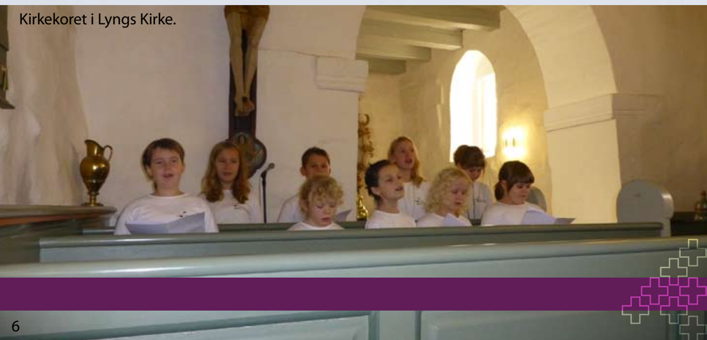
Kirkekoret i Lyngs Kirke.

Patruljemøder: Puslinge: Tirsdage kl. 17.30-19.00 1.Tumlinge: Tirsdage kl. 17.30-19.00 2.Tumlinge: Tirsdage kl. 17.30-19.00 1. Pilte: Tirsdage kl. 17.30-19.00 2. Pilte: Tirsdage kl. 19.00-20.30 Væbnerelever: Mandage kl. 19.00-20.30 1. væbnere og 2. væbnere: Mandage kl. 19.00-21.00 Tirsdag den 22. jan: "Forældreaften" i Kredshuset. Den 25. – 27. jan: Lederskole på Hardsyssel. Se mere på vores hjemmeside www.fdfthyholm.dk