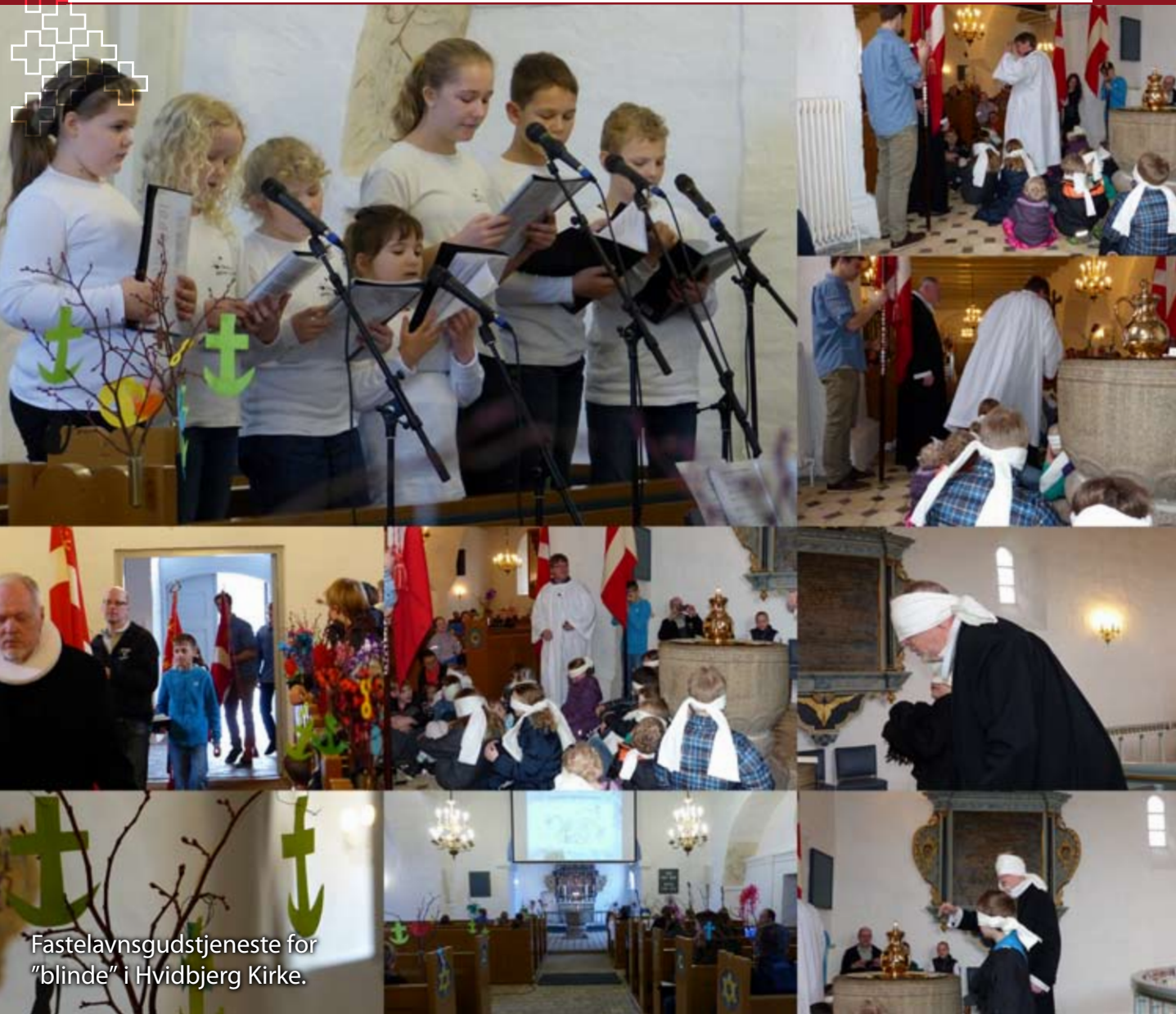
Fastelavns gudstjeneste for "blinde" i Hvidbjerg Kirke.

KIRKEBLAD FOR HVIDBJERG/LYNGS, SØNDBJERG/ODBY OG JEGINDØ