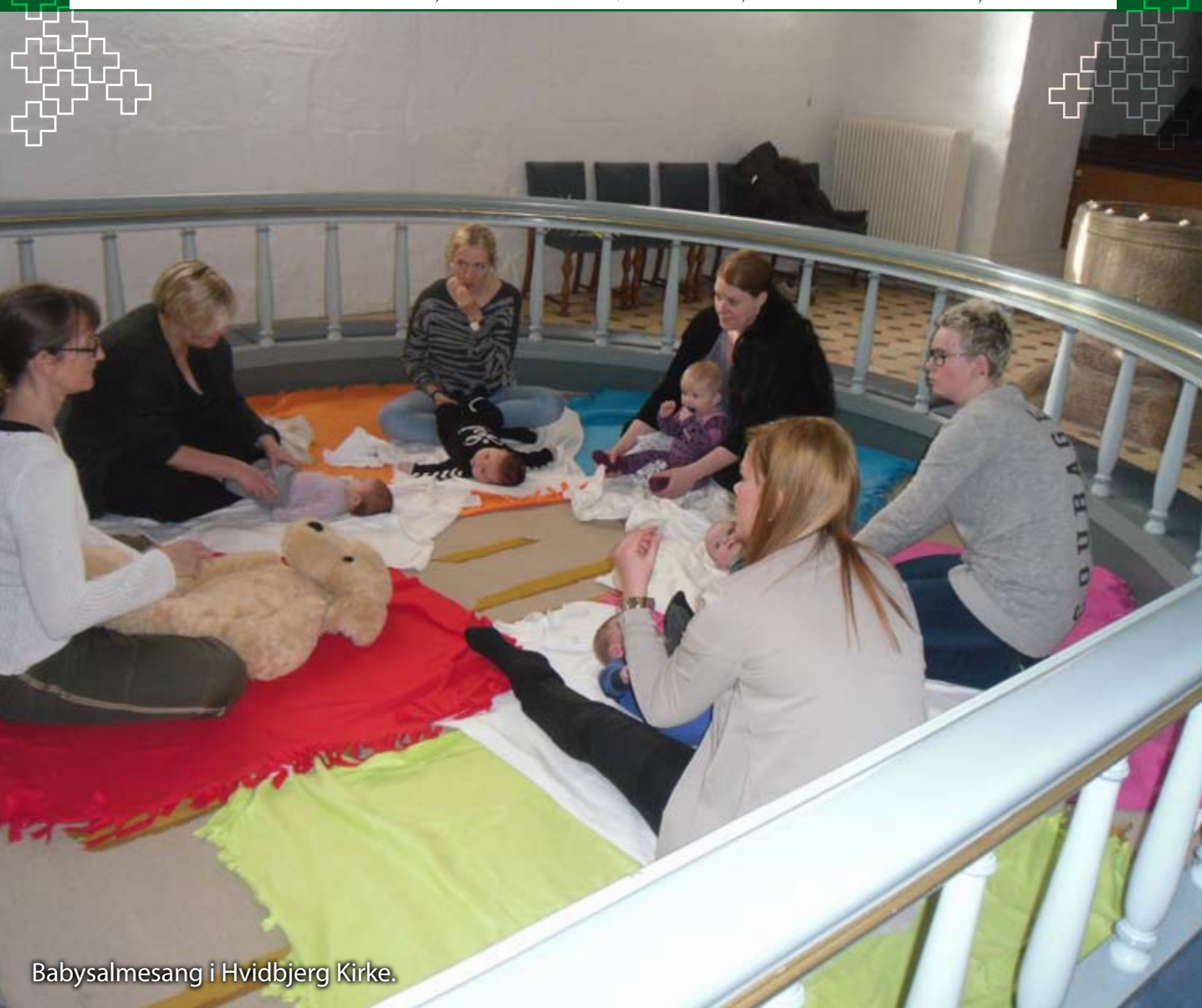
Babysalmesang i Hvidbjerg Kirke.

VI KOMMER TIL DIN KIRKE, GUD, OG FINDER DØREN ÅBEN. DET NAVN BLIR ALDRIG SLETTET UD, VI FIK HOS DIG I DÅBEN.