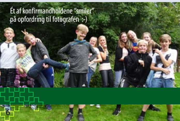
Ét af konfirmandholdene "smiler" på opfordring til fotografen :-)