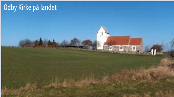
Odby Kirke på landet

Arbejdsstyrken er på 49 % og der er mange husstande med lave indkomster. 56 % af sognene har et sommerhusområde. Men undersøgelsen konkluderer, at der er god opbakning omkring den lokale kirke.