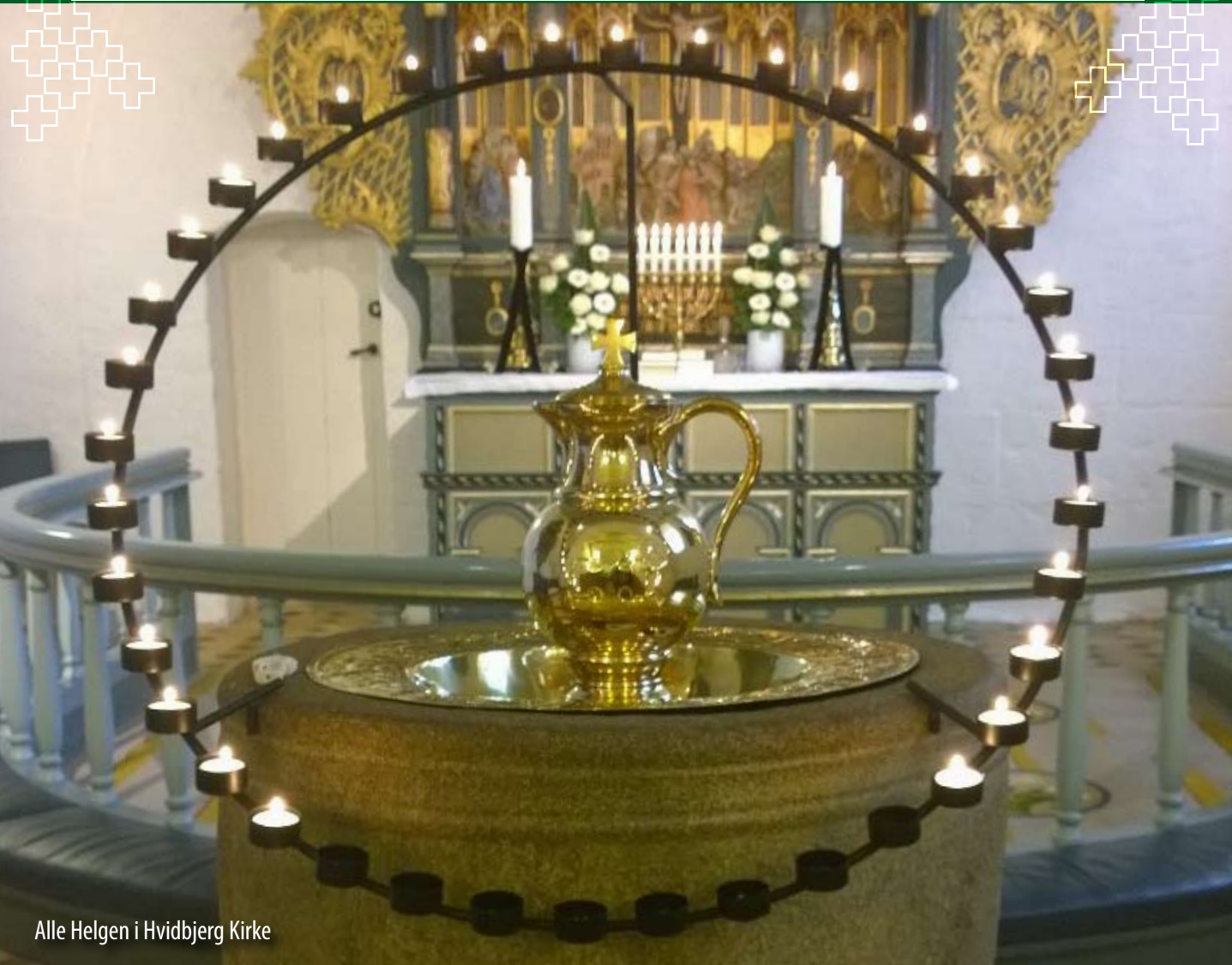
Alle Helgen i Hvidbjerg Kirke

KIRKEBLAD FOR HVIDBJERG/LYNGS, SØNDBJERG/ODBY OG JEGINDØ