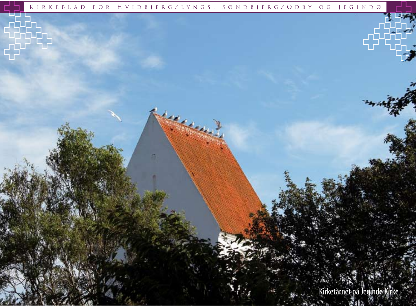
Kirketårnet på Jegindø Kirke

KIRKEBLAD FOR HVIDBJERG/LYNGS, SØNDBJERG/ØDBY OG JEGINDØ