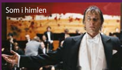
Som i himlen