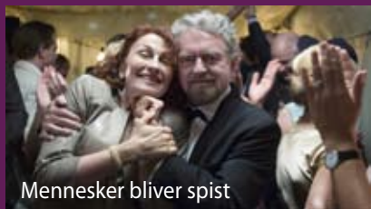
Mennesker bliver spist