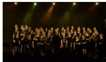
ADVENTSKONCERT I JEGINDØ KIRKE