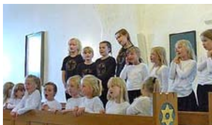
SYNG DANSK MED SPIRE- OG KIRKEKØRET