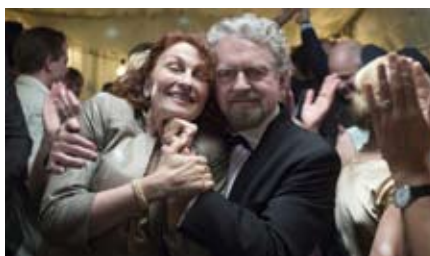
FILMSTUDIEKREDS STARTER OP I THYHOLM KIRKECENTER