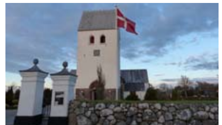
GLIMT AF NÆSTEN 25 ÅR PÅ THYHOLM