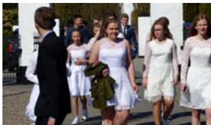
TIDEN SOM KONFIRMAND