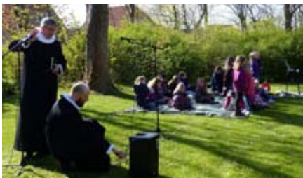
KIRKEGLIMT: FRIHED I DET FRI

I toner, ord og billeder kan man opleve lokale MENNESKER som fortolker MENNESKER! Der vil være nyt og gammelt, rytmisk og klassisk, vokalt og instrumentalt, dansk og engelsk, solosang, korsang og fællessang – noget for enhver smag!