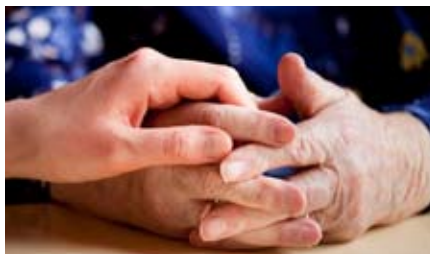
MENIGHEDSPLEJEN MÅGLER BESØGSVENNER