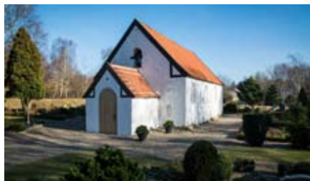
TAG MED PÅ SOGNEUDFLUGT