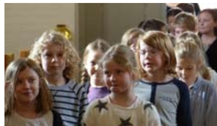
MINIKONFIRMANDERNE FYLDTE KIRKEN