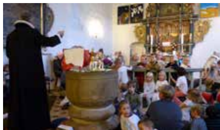
JULESTUE, JULEGUDSTJENESTER, JULETRÆSFESTER - SE ALLE JULETIDER