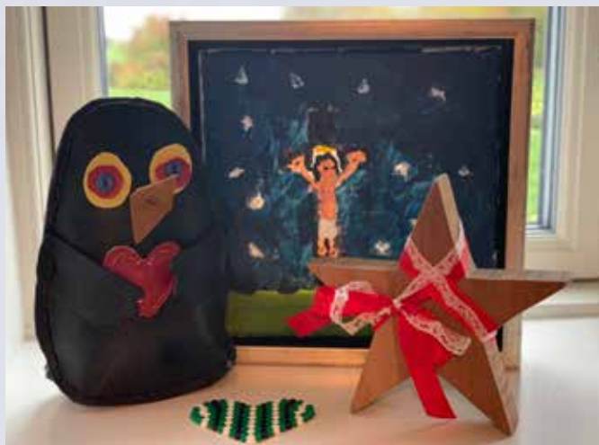
Fra samlingen: Dørstopperen, perlepladen, maleriet og sløjdstjernen.

ønskeseddel: Overrask mig! Og jeg vil sige tak og hurra – også for alt det skæve og anderledes, som jeg ikke lige kunne kontrollere gennem en lang liste til både julen og til livet.