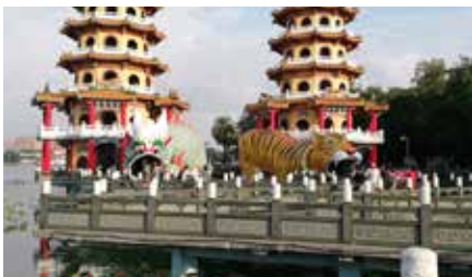
GENSYN MED TAIWAN