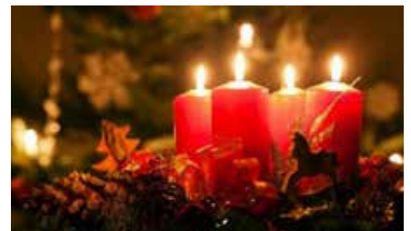
SYNG JULEN IND - SYNG DIN YNDLINGSSALME