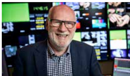
KIRKEHØJSKOLE OM KIRKELIG FORNYELSE