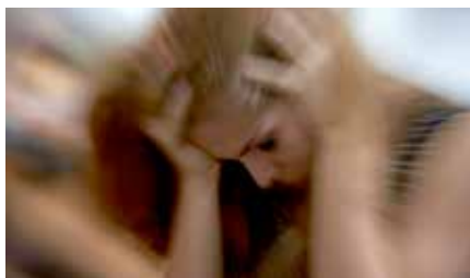
TAG KONTAKT OG TAL MED EN PRÆST