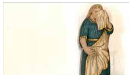
LANGFREDAGSKONCERT STABAT MATER