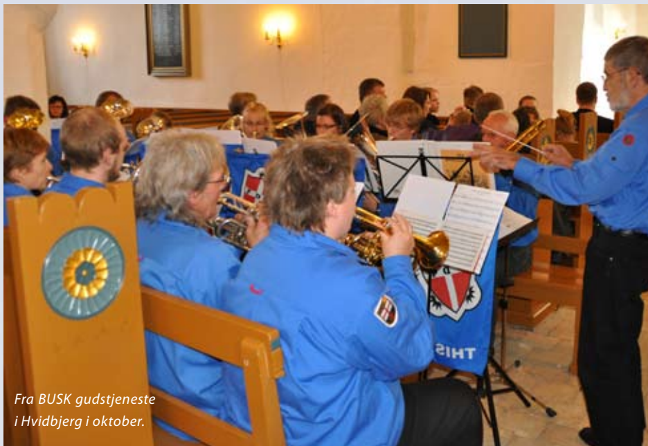
Fra BUSK gudstjeneste i Hvidbjerg i oktober.