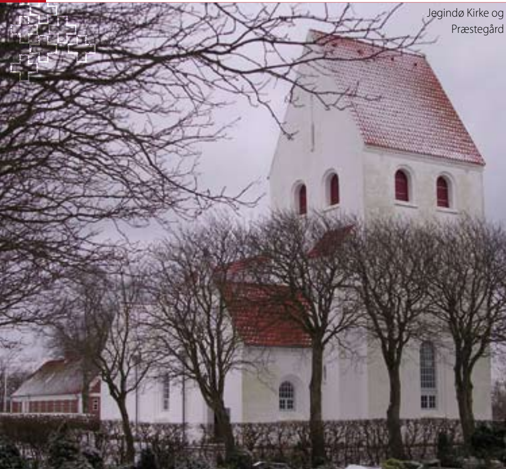
Jegindø Kirke og Præstegård

KIRKEBLAD FOR HVIDBJERG/LYNGS, SØNDBJERG/ODBY OG JEGINDØ