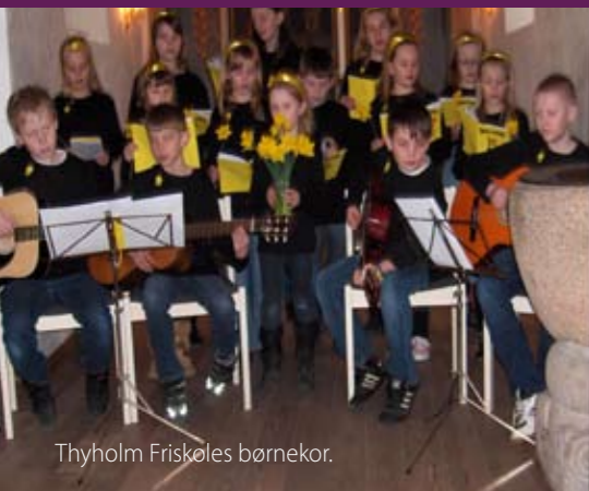
Thyholm Friskoles børnekor.